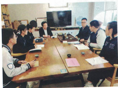
图 | 提案小组与威海市环翠区政协委员交流

以“学”开端，以“思”起航，以“践”引领，以“悟”点睛，在模拟政协的舞台上绽放青春风采，在奔跑中把握方向，感受风速，经受磨砺，做新时代中国特色社会主义的合格建设者和可靠接班人。我们心怀责任与担当，一路收获满满，用青春为祖国奉献我们的力量，绽放光彩！★