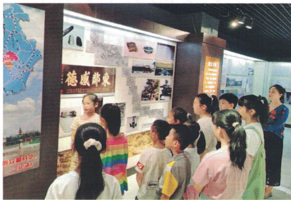
图 | 天津市北辰区北仓小学提案小组在北辰区档案馆开展调研活动

摄照片、视频等形式，将提案过程、提案方向等进行完整记录，用生动的形式对提案进行诠释。