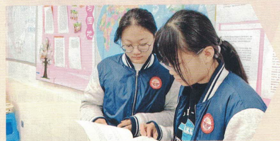
图 | 江苏省太仓市高级中学学生为提案准备素材