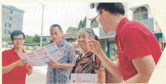
图 | 湖南湘西，吉首大学学生就提案内容深入基层调研