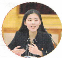
杜思睿（全国学联驻会执行主席）

全国青少年模拟政协提案征集活动是帮助青年在民主实践中体悟中国式民主于中国之真正意义的最佳实践样本之一。在本次活动中，我有幸见证了许多和我一样的同龄人在繁忙的学业生活中仍不忘用心倾听时代声音、助力国家梦想。他们没有止步于小小书斋，而是努力走出书本，从自己身边的人与事出发，走进人民生活，感受大地最有力量的心跳，传递农民工群体、留守儿童、抑郁症等弱势群体的权益表达，以学理践初心，真正确证与彰显了倾听人民声音、回应人民期待、实现人民向往，从而凝心聚力，找到全社会意愿和要求的最大公约数，画出最大同心圆，实现社会“众意”与国家“利益”相协调统一的民主真谛。★