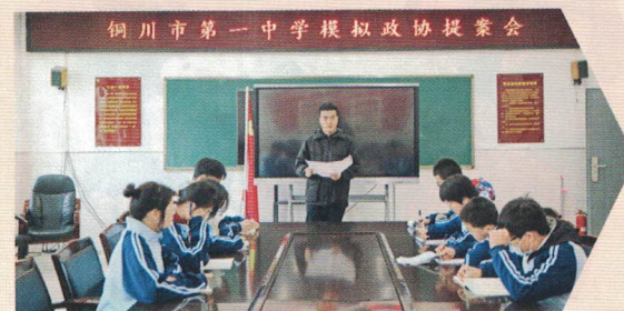
图 | 陕西省铜川市第一中学教师对学生提案进行指导

力点，并对动员部署、选题调研、提案撰写、评审评优、成果转化等各个环节细化工作要求。发布活动统一标识，提高活动的品牌辨识度。注重“数字赋能”，开发线上工作平台，实时同步工作进度，集约开展评审工作，显著提高工作效率。邀请政协机关工作人员、政协委员录制示范课，讲好政协故事、传授提案规范。