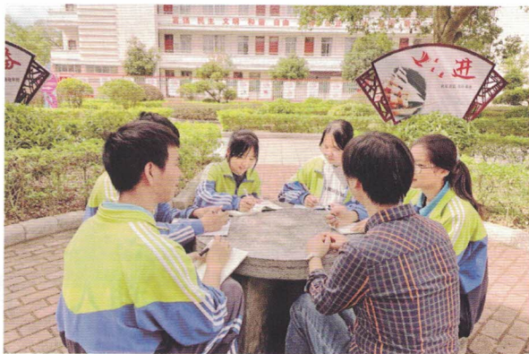
图 | 政协委员指导桂林市雁山中学学生进行模拟政协提案活动

推动参与协商工作。 健全青少年工作联席会议制度建设,协商推进青少年发展事务。组织各级团组织开展桂林“两会”前的集中活动,围绕主题开展集中协商,向人大代表、政协委员介绍情况、凝聚共识,推动相关议案、建议、提案得到有效办理。组织旁听桂林“两会”“共青团与人大代表、政协委员面对面”等系列活动,汇集广大青少年建议,配合市人大做好青少年相关的调研工作。桂林“两会”后,充分发扬严实作风,建立规范的办理工作机制,按时提交高质量的答复意见。与提出议案、建议和提案的人大代表、政协委员建立全过程联系,切实做到办前有沟通、办中有联系、办后有反馈,同时注意发挥他们的专业优势和社会影响力,使其成为共青团开展工作的重要支持。加强对议案、建议和提案内容的综合分析,充分发挥青少年问题“晴雨表”“数据库”作用,及时掌握社会关切,将其中蕴含的“真言”“良策”转化为改进共青团工作的实际举措。参与《广西壮族自治区预防未成年人犯罪条例(草案)》(征求意见稿)《广西壮族自治区法治宣传教育条例(草案)》《桂林市关于全面推进社会治理现代化“十四五”规划》(征求意