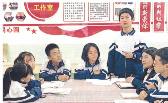
图 | 太原市尖草坪区第二中学学生分组讨论提案

积极思考总结梳理。在学校教师和校外导师的指导帮助下，“小委员”们通过集中培训、成立小组、实地调查、走访座谈、分组讨论等，将收集到的问题和自身思考进行总结梳理，撰写并提交了《关于党群服务中心周末向中小学生开放的提案》《关于将心理健康课纳入中学课程体系的提案》《关于扩大中小学男教师比例的提案》《关于严格控制中小学多媒体等电子设备的提案》等多篇提案，其中《关于将心理健康课纳入中学课程体系的提案》入围全国