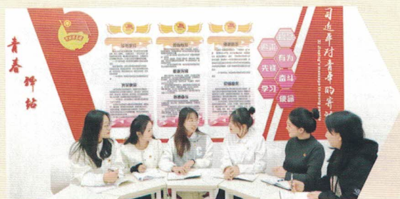
图 | 沈阳师范大学提案团队研讨提案作品