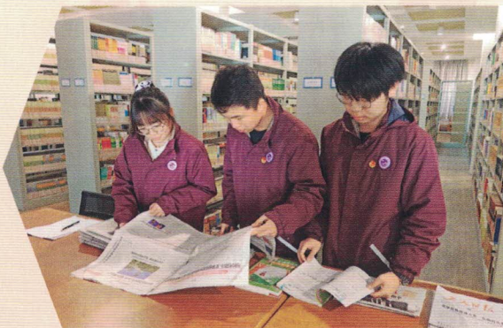
图 | 上海市崇明区扬子中学提案小组搜集提案资料

团中央制定《青少年模拟政协提案征集活动工作指引》,引导各级团组织根据中学生、大学生、社会青年等不同工作对象,分层分类把握活动的着