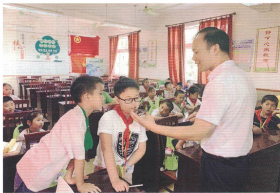
图 | 政协委员走进上海市奉贤区肖塘小学进行指导

探索“青少年模拟政协”新路径。联络组面向有意参与“模拟政协”活动的青少年进行专题辅导，组织青少年围绕选题，走进基层开展调研，提出针对性、操作性强的政策建议。