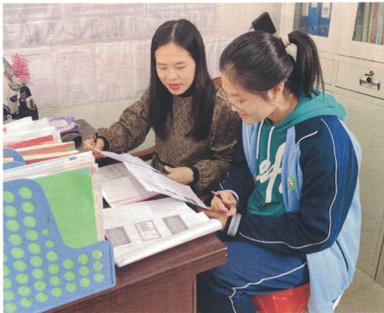
图 | 海南省儋州市松涛中学教师指导学生撰写提案

同时，持续推进“共青团与人大代表、政协委员面对面”活动，把“面对面”活动作为青少年制度自信教育的重要载体，为模