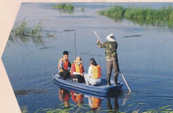
图 | 东北林业大学学生为为做好提案开展实地调研