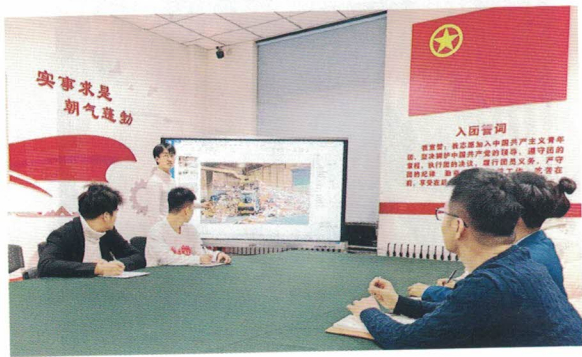
图 | 提案团队在学校青年之家进行选题分析

通过模拟政协提案形成过程，可以使青少年了解我国协商民主制度，提升了协商能力。这项青少年创新实践活动开启了青少年参与社会生活、承担公共责任的实践之路，更开启了学生树立公民意识、培养家国情怀之路。★