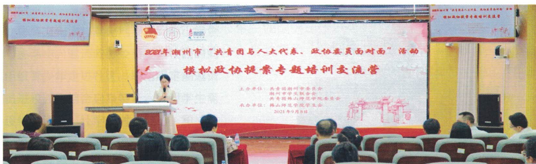
图 | 团潮州市委、市政协提案委联合举办潮州市 “共青团与人大代表、政协委员面对面”活动之模拟政协提案专题培训交流营