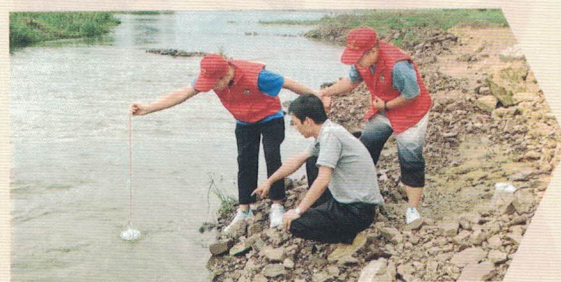
图 | 山东水利学院护航美丽河湖提案小组进行水情水生态观测