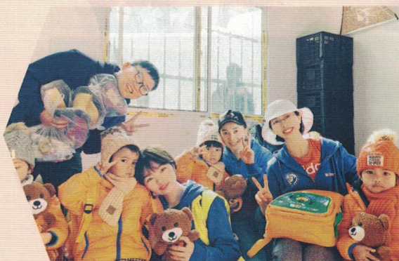
图 | 云南省昆明市禄劝县,提案小组就关于完善留守儿童假期陪伴的提案进行实地考察